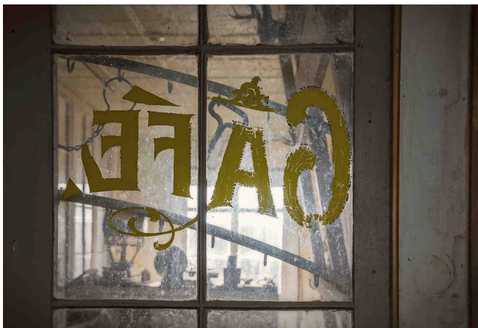
akahnkeyefian, 2014. Certains droits réservés (cc)

Organisatrice communautaire CSSS Jeanne-Mance