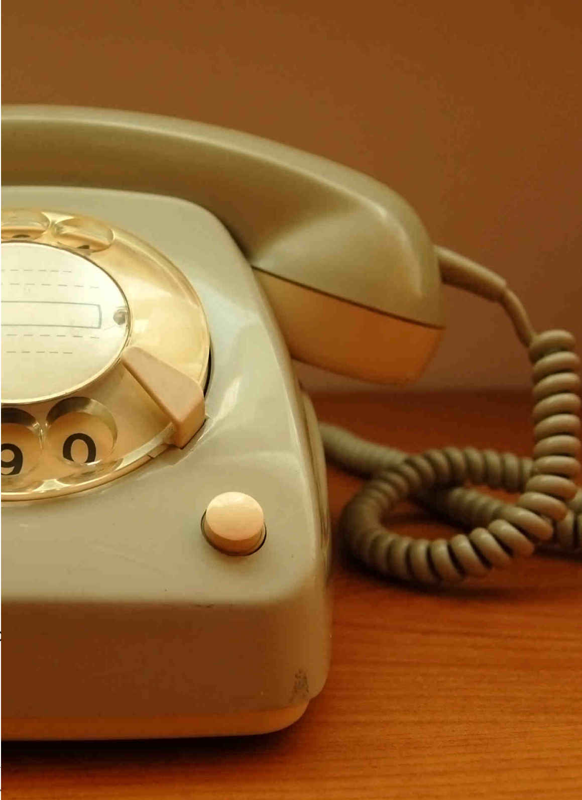
Ryboon, 2008. Certains droits réservés(cc)