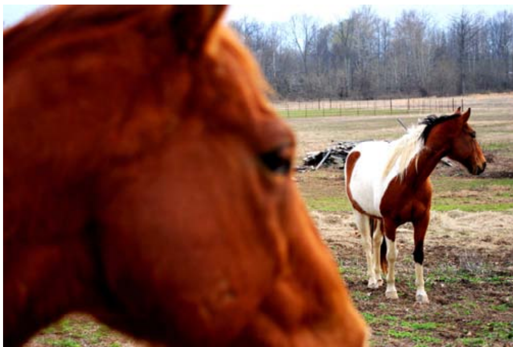
Amorillan, 2011. Certains droits réservés (CC)

Si on prend l'exemple des résidents en centre