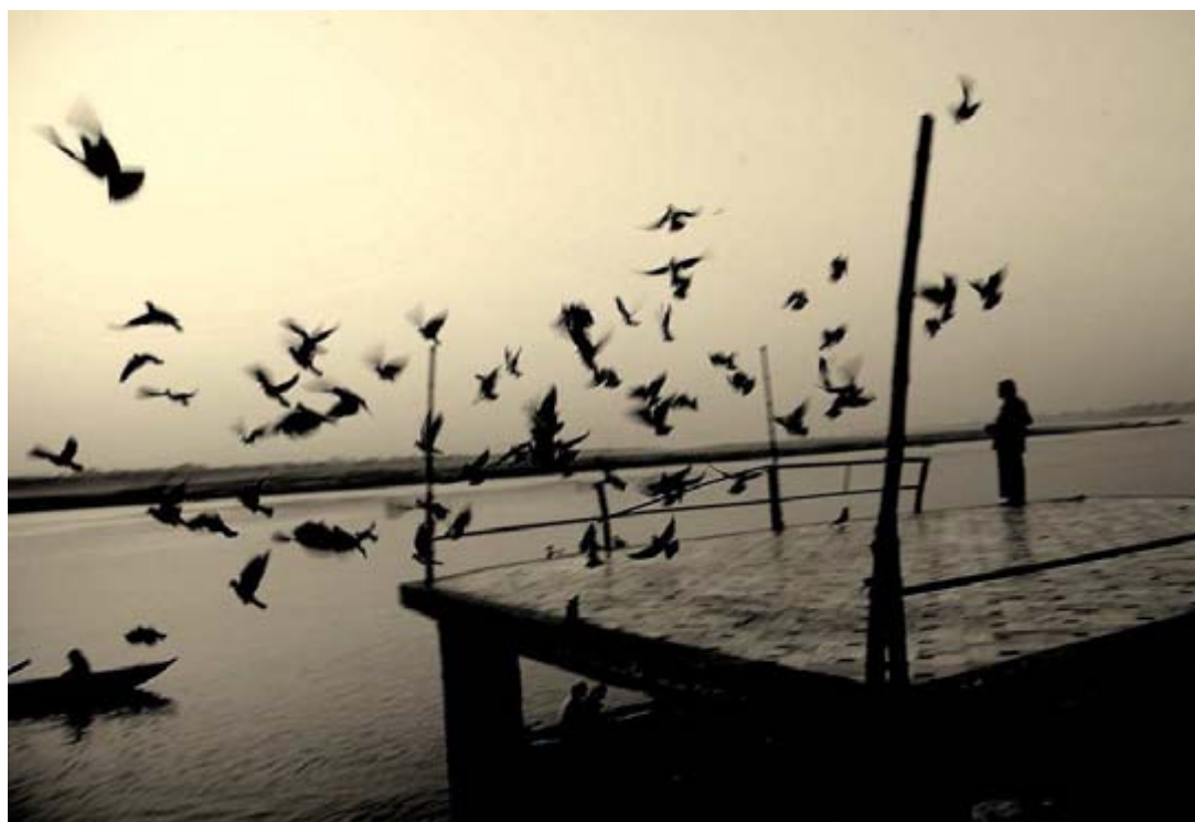
le cercle, 2009. Certains droits réservés.

« Il n'est pas toujours aisé de savoir ce qui déclenche le processus de changement chez les personnes toxicomanes. C'est parfois une crise de santé majeure ou des expériences qui rapprochent de la mort, comme une hospitalisation en soins intensifs ou une agression. »