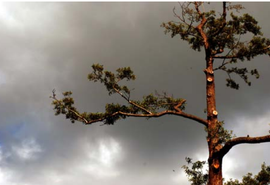
Creatissima, 2007. Certains droits réservés

Nous avons développé une expertise dans le domaine de la psychiatrie des toxicomanies. Certaines personnes connaissent des problèmes de santé mentale induits par la consommation, alors que d'autres ont des problèmes psychiatriques indépendants de l'usage, mais qui sont compliqués à tel point par l'usage de substances toxiques que les diagnostics sont parfois difficiles à poser. La dépression est le problème induit le plus commun avec la consommation de toutes les substances. Des psychoses sont également reliées à l'abus de certaines substances, telles que les stimulants (cocaïne et amphétamines) et les hallucinogènes (par exemple, le PCP). 4 Les troubles de personnalité sont un terrain favorable au développement d'un problème de consommation. À cet égard, l'intervention en groupes de discussion à l'externe, organisés par une travailleuse sociale et une infirmière en psychiatrie, permet des apprentissages positifs dans la gestion des conflits et des impulsions. Cela améliore la