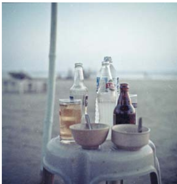
Le cercle, 2011.