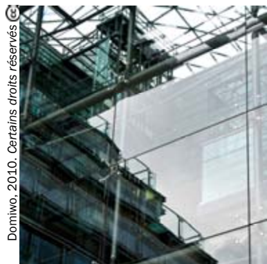
Domitov, 2010. Certains droits réservés

Inégalités sociales Discriminations Pratiques alternatives de citoyenneté