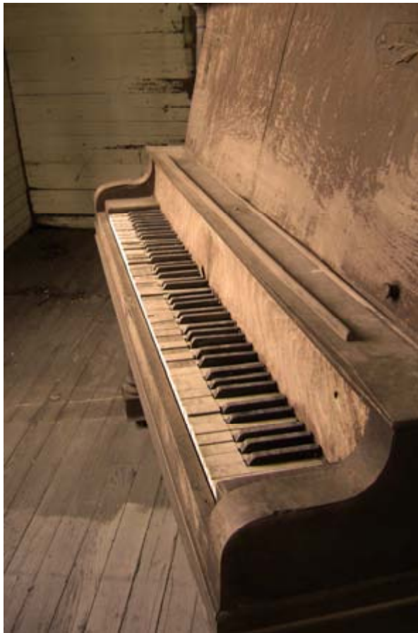
Emilio Ober, 2009. Certains droits réservés.

nombre de personnes vivant avec un handicap ou des problèmes de santé mentale. À la fermeture de l'établissement, en 2003, plusieurs ont été relocalisées à Plessisville dans des appartements ou des résidences privées, souvent laissées à elles-mêmes. Pour ces personnes, pour la plupart