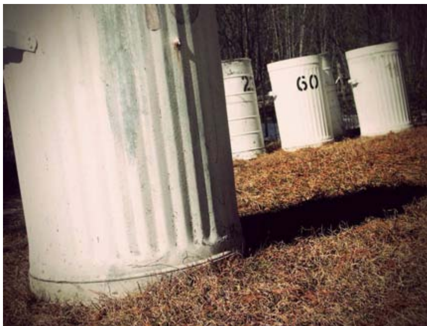
Dimitric, c. 2008. Certains droits réservés

À la fin de la journée, tous les participants regagnent les logements qu'ils occupent pour la semaine. En route, nous discutons du problème soulevé plus tôt. « Oui, c'est bien qu'il soit intervenu. Il faut changer notre façon de discuter. Il faut être plus attentif. Je ne savais pas qu'on pouvait être intimidant. » C'est un constat inquiétant de réaliser qu'on participe parfois soi-même à ce qu'on dénonce. Expérience d'humilité et d'authenticité. La remise en question