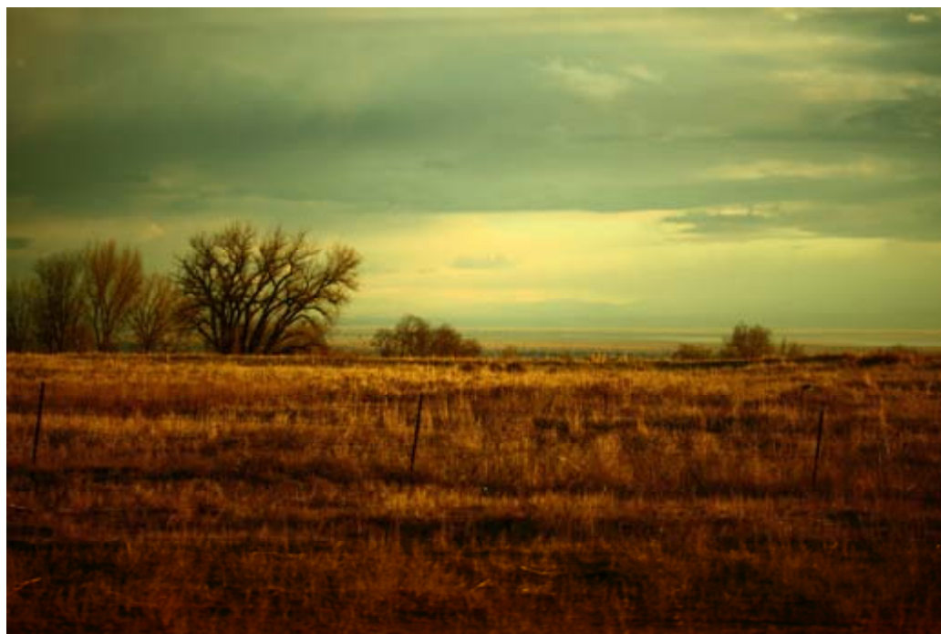
dsputit, 2011. Certains droits réservés

« On revendique surtout dans ces entrevues d'être reconnu comme un être humain à part entière, avec son histoire, ses besoins, ses problèmes de logement, d'alimentation, de santé, mais aussi avec ses compétences, sa capacité de contribuer à la société, de participer »