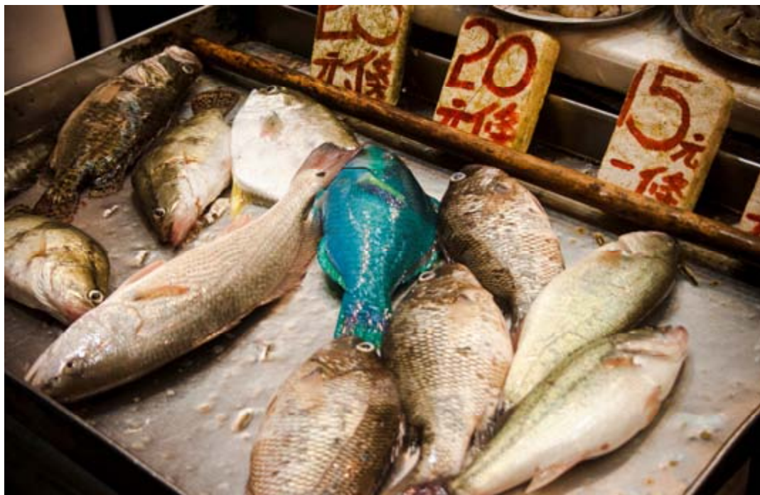
Yanhoon, 2011. Certains droits réservés

sont passés. Des jeunes demandent à être tenus informés des activités du CREMIS.