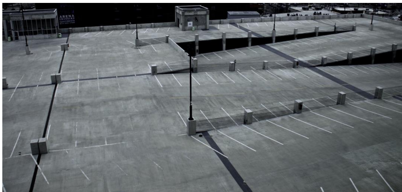
Vistavision, 2014. Certains droits réservés

tairement chez les non-diplômés, mais on les observe également chez des diplômés âgés d'une trentaine d'années ou plus, en recherche prolongée d'emploi, notamment à Paris et Madrid. Ces phases de parcours sont alors associées, dans les récits de vie, à des « temps morts », teintés de découragement. Si la famille permet un filet de sécurité relatif, elle n'empêche pas un sentiment aigu de solitude sociale, et accentue le sentiment d'échec individuel. Chez des individus émancipés de leur famille ou en situation de rupture familiale, les problématiques saillantes sont celles du surendettement et de l'insécurité alimentaire, sur fond de parentalité précoce : une partie de l'inactivité féminine comptabilisée dans la catégorie « NEET » est effectivement composée de jeunes mères isolées (Carcillo et al. , 2015). Dans la plupart des cas, le rapport au temps individuel et collectif devient marqué par une incertitude radicalisée quant à l'avenir, et une forme d'enfermement dans le présent. On peut s'interroger sur les conséquences politiques et citoyennes de ces formes de vulnérabilité durable : les récits de vie montrent qu'elles peuvent se traduire, chez certains jeunes adultes, par un processus de désadhésion sociale. Celui-ci se caractérise par une dissociation entre le « soi » et la « société », un sentiment de ne pas être représenté, et une forme accentuée de