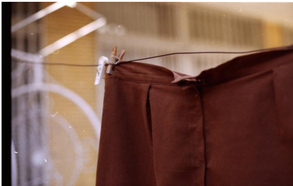
Zoghbi, 2012. Certains droits réservés

rents partenaires, mais aussi de leurs personnels et bénéficiaires, est considérée comme tout aussi délicate qu'essentielle. Or, un certain nombre d'éléments, qui ne pourront pas tous être développés ici, révèlent une asymétrie de positions au sein du collectif de partenaires.