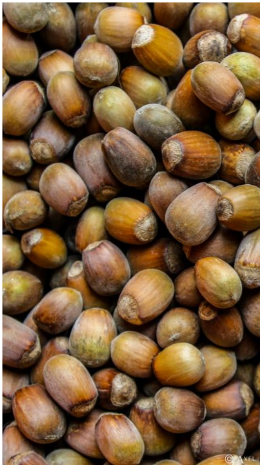
Alex Naud, 2014. Certains droits réservés

continuum paradigmatique » (Rivard, 2008 : 290), au service des jeunes en situation de grande précarité. Tous y ont à gagner et chaque année, les mêmes acteurs redisent leur attachement à ce modèle.