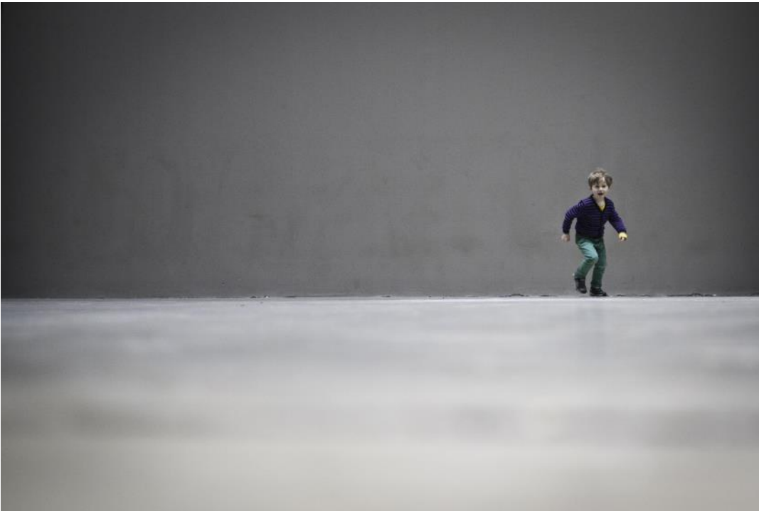
Owenbooth, 2013. Certains droits réservés

Ici aussi c'est des ponts entre pratiques professionnelles et citoyennes que pourra se dégager un commun indéterminé, mais porteur de sens. Il faut pour qu'il adienne, des pratiques dans lesquelles chacun peut déplier et choisir d'articuler ou pas son activité propre. Les savoirs des pairs aidants et des experts du vécu sont ici de la plus grande importance. L'attention des chercheurs à la bonne compréhension et à la bonne réception de ces savoirs doit être de tous les instants.