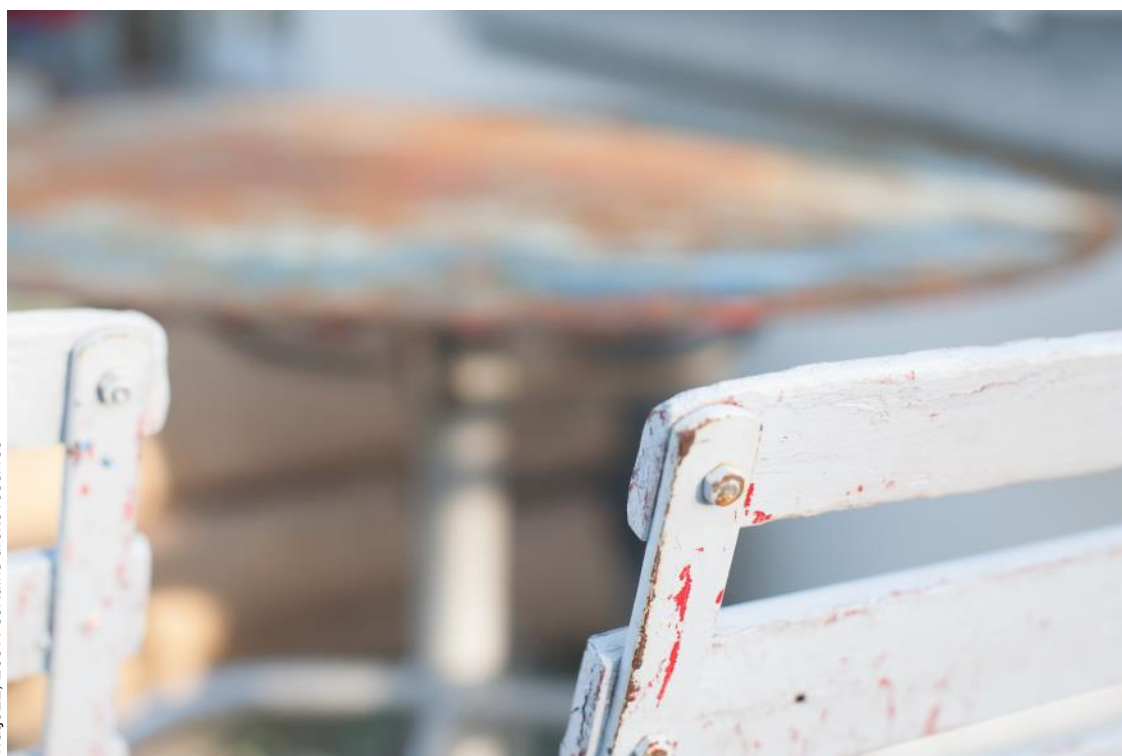
Watje1.1., 2007. Certains droits réservés