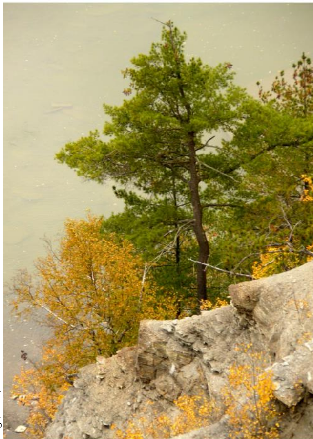
Sage, 2008. Certains droits réservés

La diffusion de ces discours alimente la production d'un